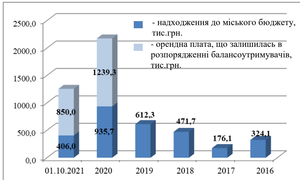
Рис. 1 Надходження орендних платежів, тис. грн.

З 2018 року продаж об'єктів малої приватизації здійснюється в електронній торговій системі «Прозорро.Продажі» шляхом проведення аукціонів. В 2021 році станом на 01.10.2021 року продано 5 об'єктів нерухомого майна. Станом на 01.10.2021 року надходження до міського бюджету від продажу об'єктів комунальної власності склали 579,0 тис. грн. (рис. 2).