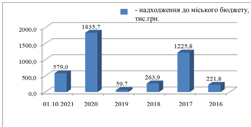
Рис. 2 Надходження до міського бюджету від продажу об'єктів комунальної власності, тис. грн.

З 2018 року продаж об'єктів малої приватизації здійснюється в електронній торговій системі «Прозорро.Продажі» шляхом проведення аукціонів. В 2021 році станом на 01.10.2021 року продано 5 об'єктів нерухомого майна. Станом на 01.10.2021 року надходження до міського бюджету від продажу об'єктів комунальної власності склали 579,0 тис. грн. (рис. 2).